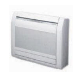
AGY 25-35-40 UI-MI