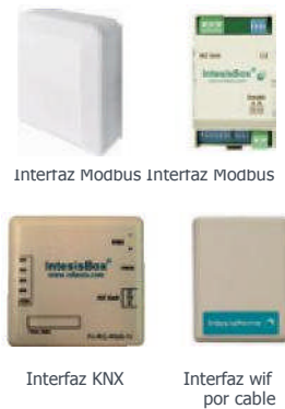
Interfaz KNX Interfaz wif por cable