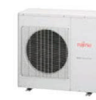
AOY 80 UI-MI4