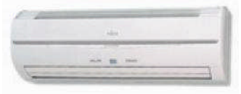
ASYE 4-14 G ASYA 4-14 G