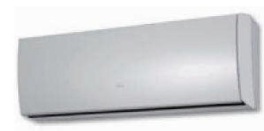
ASY 25-35 UI-LI

* Disponibilidad a partir de Junio de 2016