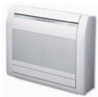
AGY 25-35-40 UI-LV