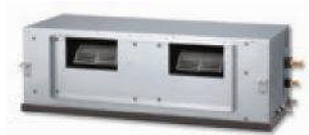
ARYC 72-90 GEC