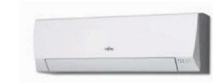
ASY 25-35 UI-LLCC