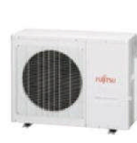
AOY 50-71 UI-MI3