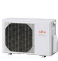
AOY 40-50 UI-MI2

*Clase energética presentada en combinaciones 2x1 con unidades exteriores AOY40-50UI-MI2, AOY50UI-MI3