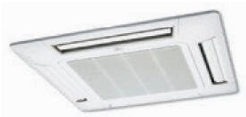
AUYC 18G-24G / AUYA 18G-34G