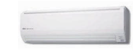
ASY 50-71-80 UI-LF