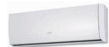
ASY 25-35 UI-LU