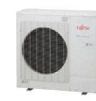
AOY 125 UI-MI8