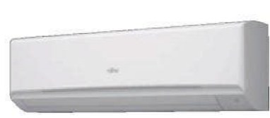
ASY 80-100 UI-LM