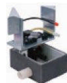
Elevador agua drenaje